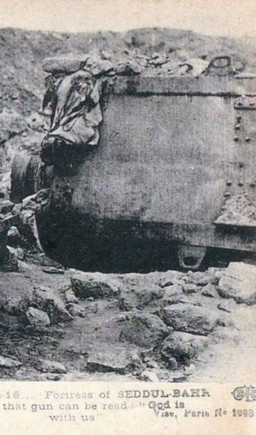
15... Fortress of SEDDUL-BAHR that gun can be read: "God is with us" Vise, Paris No 1098