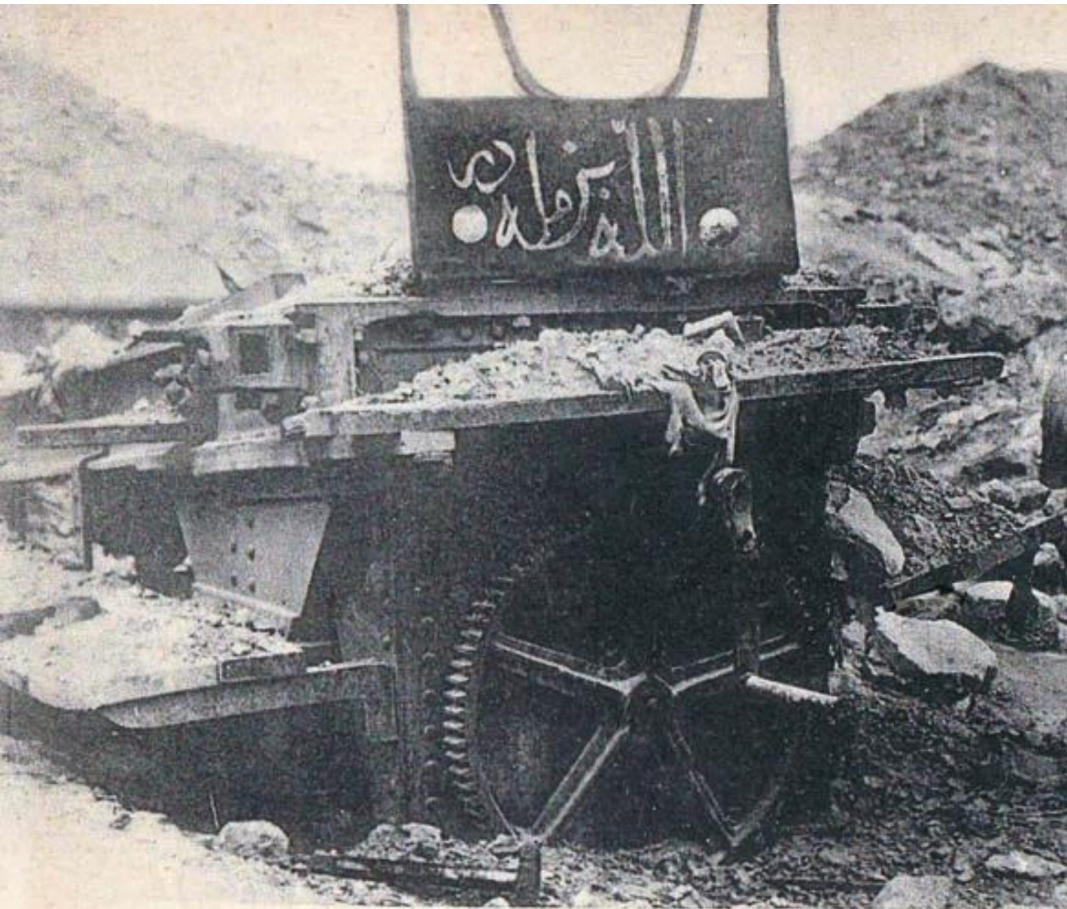
Guerre 1914-15... Forteresse de SEDDUL BAHR Sur ce canon on peut lire : " Dieu est avec nous "