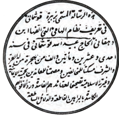
↑ Zebîre-i Kuşmanî kitabının ünvan sayfası ← Nizam-ı Cedid ordusu resmigeçitte

Her hususta zahîren ve bâtinen noksanlık, kulların kendisindedir. Yoksa Hazret-i Feyyaz-ı Kibriya, cimrilikten beridir. İhsan etmeyi ve etmemeyi, almayı ve vermeyi, maddî ve manevî sebeplerle kullarının idrakine, anlayışına ve muamelelerine bağlamıştır.