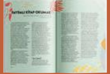
Okumakla ilgili sözler ve yazılar