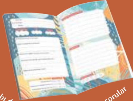
Kitabı deđerlendirmenize yardımcı sorular