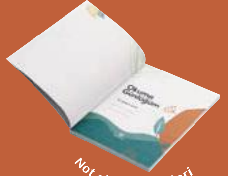
Not alma bölümleri

Okuduđunuz kitaplara dair öğrendiklerinizi, görüş ve önerilerinizi yazıp yıllar boyu saklayabileceđiniz özel bir defter. İleride bu deftere baktığınızda yalnızca okuduđunuz kitapları deđil, o âna dair pek çok güzel hatıranızı bulacaksınız.