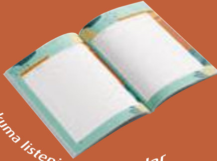
Okuma listeniz için tablolar