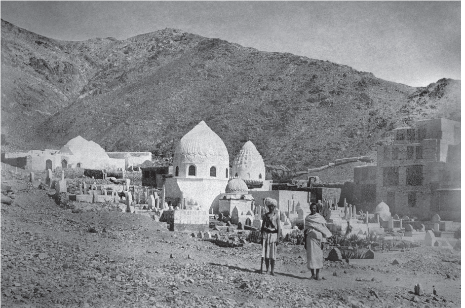
Cemetü'l-Muallâ (Mekke - 20. yüzyıl başları)