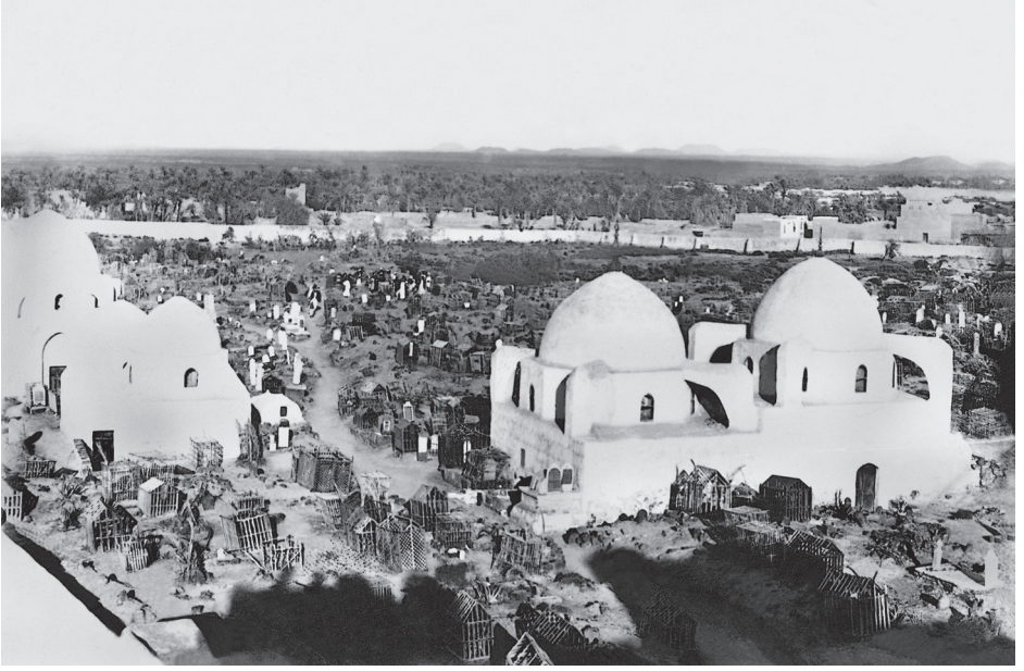
Cemetü'l-Bakf (Medine - 20. yüzyıl başları)