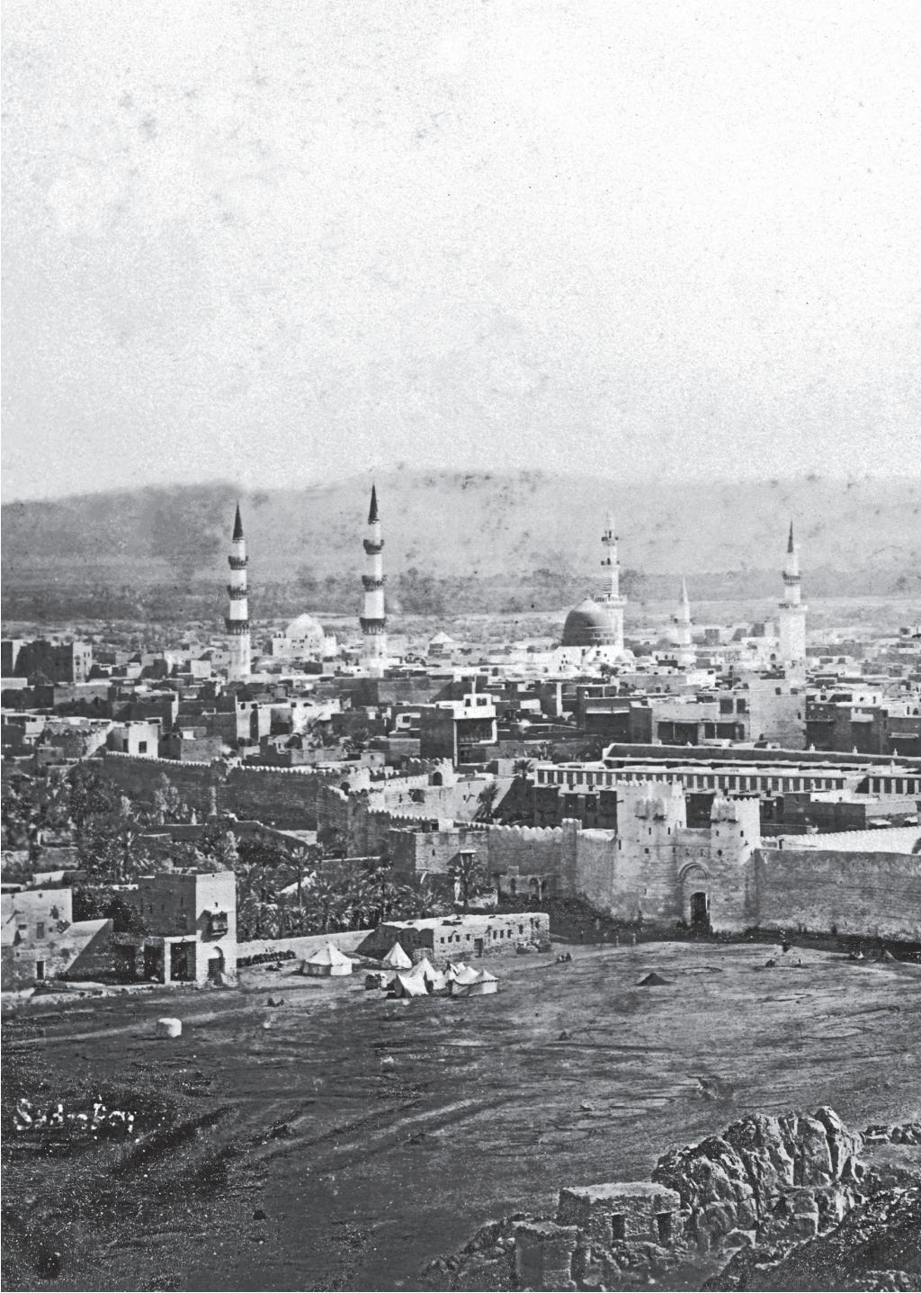
20. yzyıl bařlarında Medine-i Mnevvere