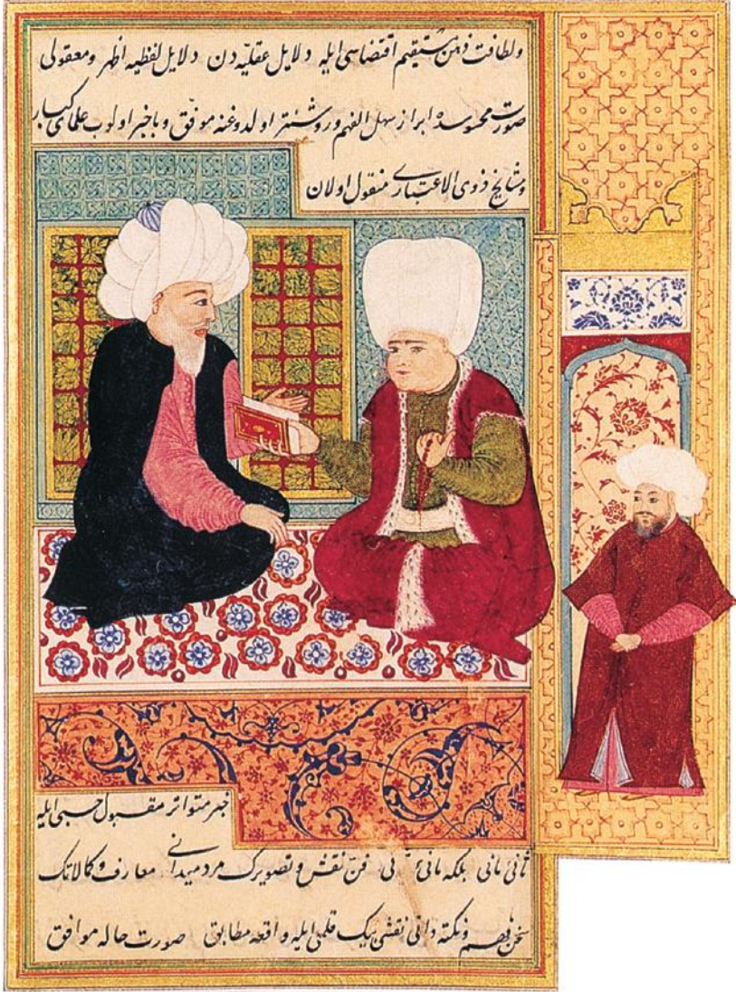
Sultan Genç Osman'a bir kitabın takdimini gösteren minyatür