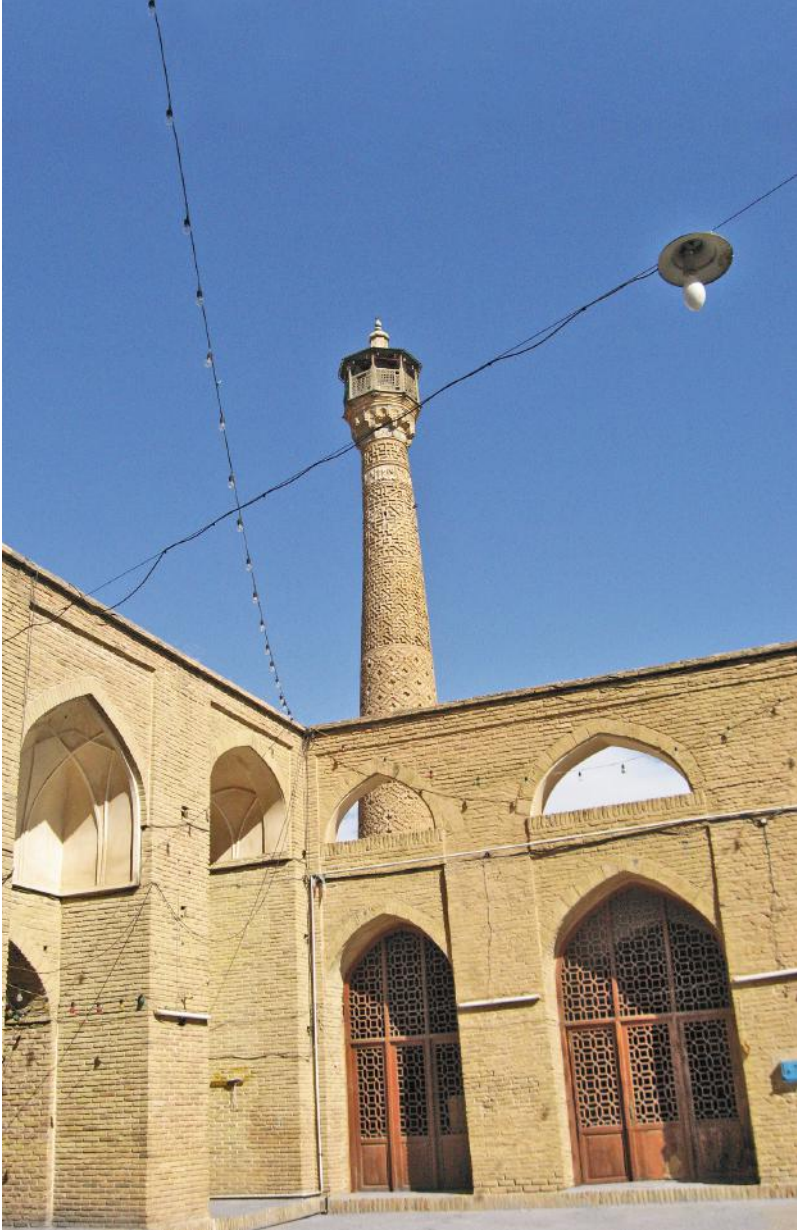
Cuma Camii Semnan - İran