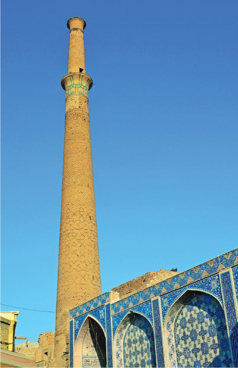
Ali Camii ve Minaresi İsfahan - İran