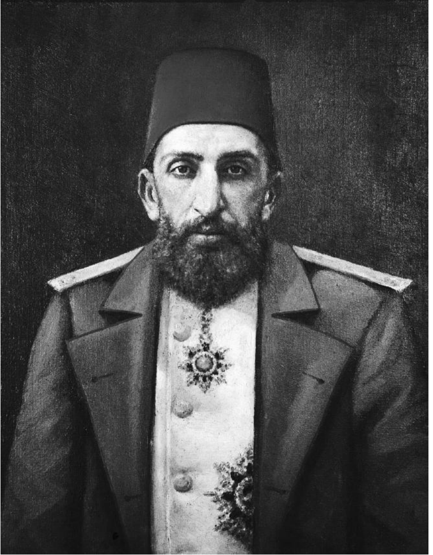
Sultan İkinci Abdülhamîd Han'ın Zonaro tarafından yapılmış portresi