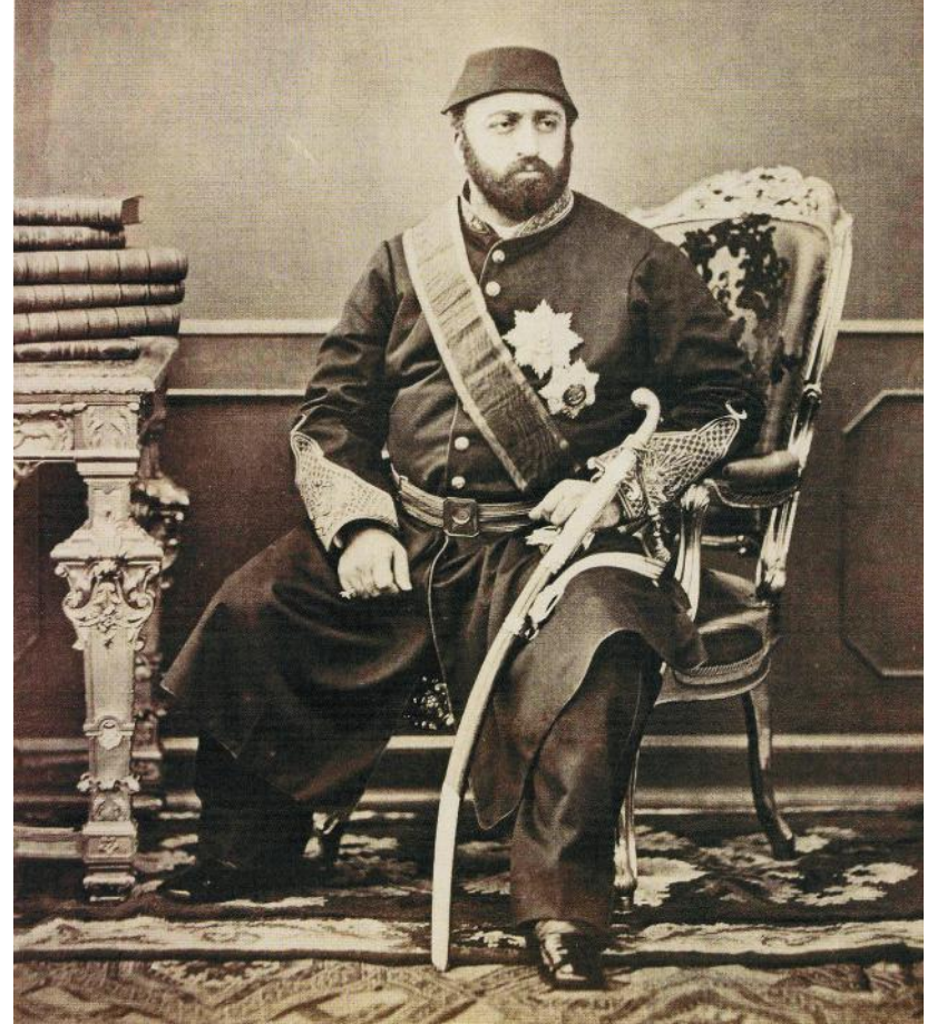
Sultan Abdülaziz Han

Boğaziçi'ni çeşitli yapılarla süsleyen en önemli Osmanlı sultanı Abdülaziz Han'dır. Onun devrinde inşa edilen ve günümüzde de hâlâ ayakta olan muazzam eserlerin yanında Abdülaziz Han, kıyamete kadar hayırla yad edilecek ve kendisi için sadaka-i cariyeye olacak bir cami inşa ettirmek istiyordu. Ecdadı gibi İstanbul'un hâkim bir tepesini seçerek hem İstanbul'a hem de hanedana yakışacak, abidvî nitelikte bir eserin peşindeydi. Kendisi bizzat araştırmalar yaptı ve Boğaz'ın en güzel manzaralı seyir te-