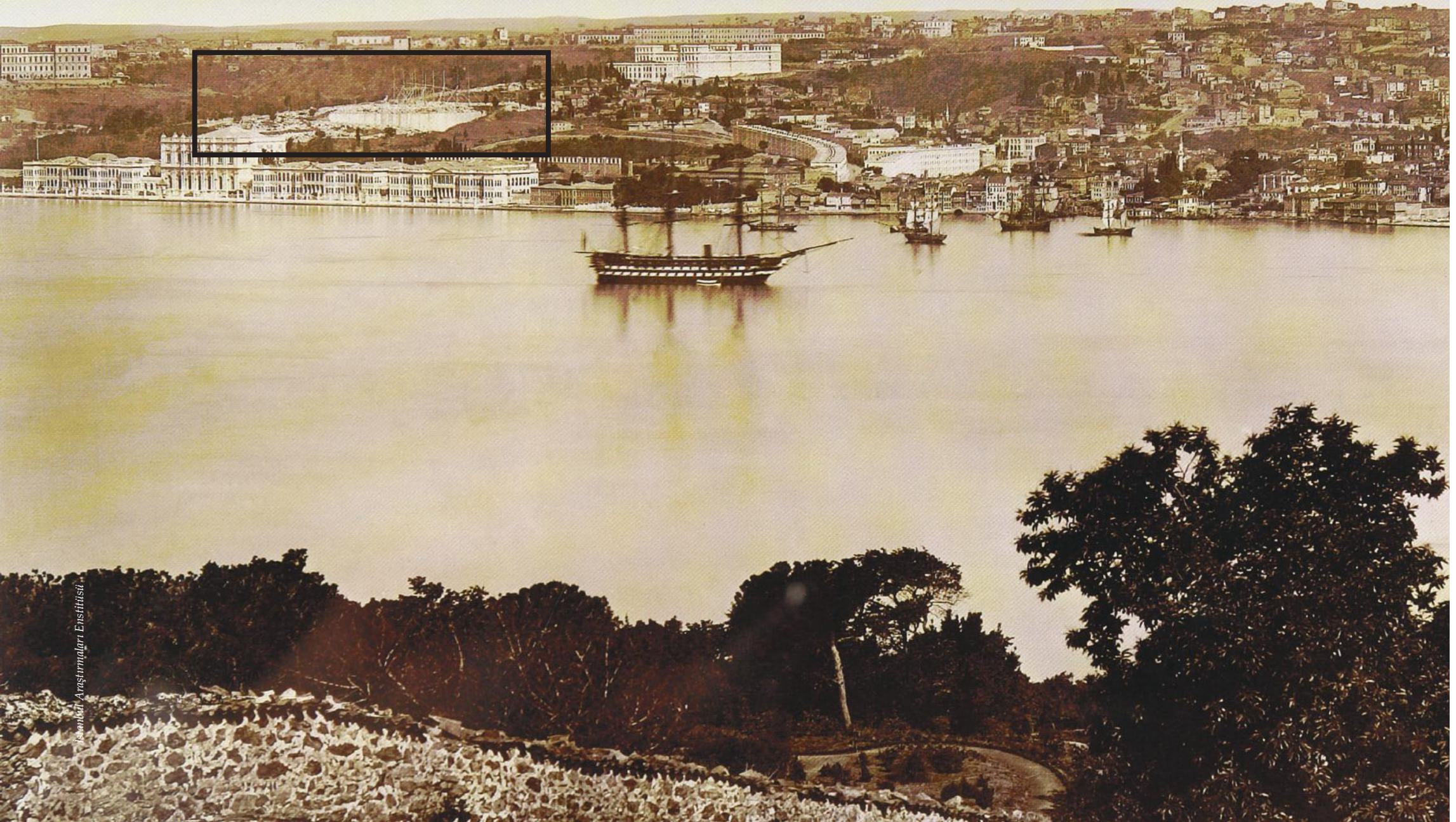
1875 yılına ait fotoğrafta, Dolmabahçe Sarayı'nın hemen yukarısında, Aziziye Camii'nin temelleri ve inşaattaki iskeleler görülmüyor