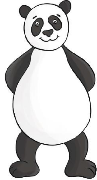
Dodo - Baba

Dido annesini, babasını ve kız kardeşini arıyor.