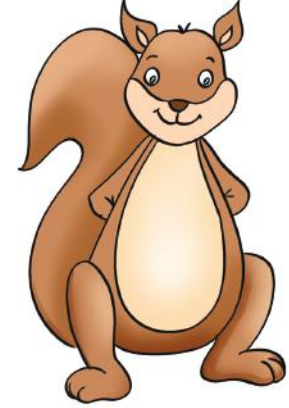
Dido - Erkek çocuk