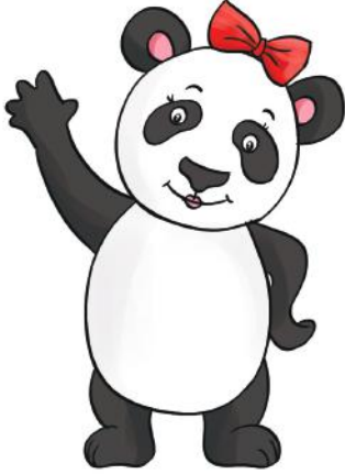
Didi - Kız çocuk