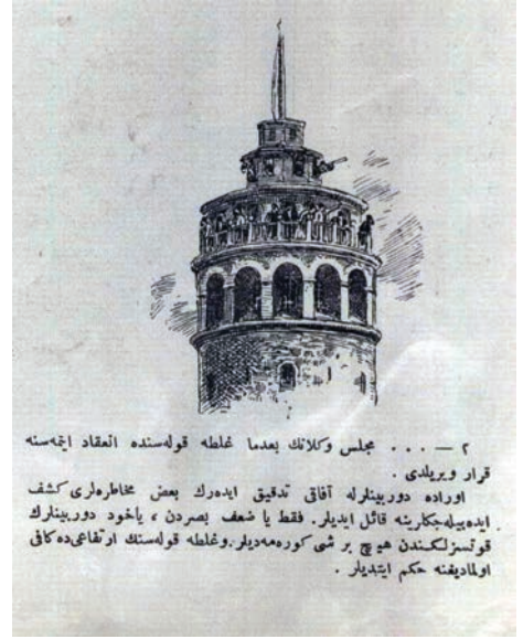
۴ — مجلس وکلانک بعدما غلطه قولهسنده انعقاد ایتمهسه قرار ویریلدی . اوراده دوربینلرله آفاق تدقیق ایدرک بعض عیاطره لری کشف ایده بیله بیکارینه قائل ایذیلر . فقط یا ضعف بصردن ، یا خود دوربینلرک قوتسزلکنندن هیچ بر شی کورمه دیرلر . و غلطه قولهسنک ارتقاعی ده کافی اولمادیغه حکم ایذیلر .

(Ancak talihleri bir türlü yaver olmadı. Balondan, dürbünle ne tarafa baksalar bir karanlık görünüyordu. Tehlikeye dair bir işaret ve iz yoktu. Vekiller Heyeti bu işle uğraşırken, semanın derinliklerinden bir bora ve şiddetli fırtına zuhur etti. Balon hâlâ gidiyor...)