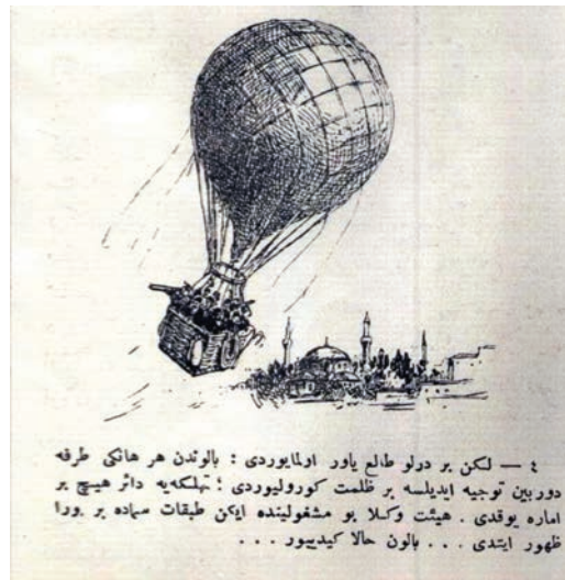
۵ — لکن بر درلو طالع یاور اولمایوردی : بالوندن هر هانکی طرفه دوربین توجیه ایذیلسه بر ظلمت کورولویوردی ! تهلکهیه دائر هیچ بر اماره یوقدی . هیئت وکلایو مشغولینده اینک طبقات سیهاده بر بورا ظهور ایتمدی . . . . بالون حالا کیدیور . . . .

(İstanbul'da daha yüksek bina olmadığı için Eyfel Kulesi'nin satın alınarak İstanbul'a getirilmesi ve Galata Kulesi'nin üzerine perçinlenmesi teklif edildi. Fakat teklif, bir oya karşı oy çokluğuyla reddedildi. Nihayet, meclisin bir balonda toplanmasına karar verildi.)