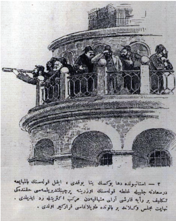
۳ — استانبولده دها یوکسک بنا یوقدی ، ایفل قولهسنک بالمبایعه درسعاده جلبیله غلطه قولهسنک اوزرینه پرچینلدریلیمهسی حقتدهی تکلیف بر رایه قارشى آران متبایقه دن همکب اکثریتله زد ایذیلدی . نهایت مجلس وکلانک بر بالونده طویلناماسی قرارکیر اولدی .

(Meclisin bundan sonra Galata Kulesi'nde toplanmasına karar verildi. Orada dürbünlerle ufku gözetleyerek bazı tehlikeleri görebileceklerini düşündüler. Fakat ya gözlerinin zayıflığından yahut dürbünlerin yetersizliğinden hiçbir şey göremediler. Ve Galata Kulesi'nin yüksekliğinin kâfi olmadığına hükmettiler.)