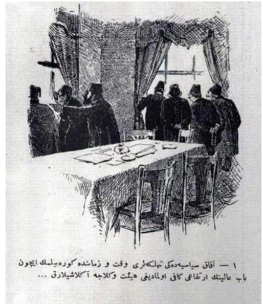
۱ — آفاق سیاسیه‌دهکی تهلیکله‌ری وقت و زمانده کوره بیلدک ایچون باب عالی‌نک ارتقاعی کافی اولمادیغی هیئت وکلایه آکلاشیلاراق ...